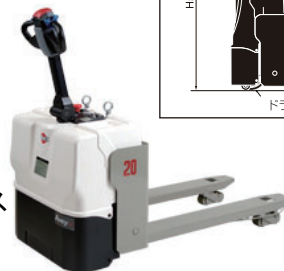
アンティエースプラス BCP-20JP