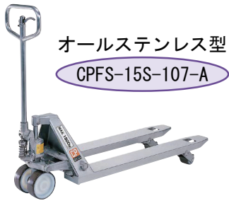
オールステンレス型 CPFS-15S-107-A