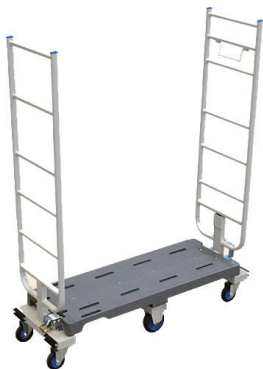
6輪スリムカート ネスティングタイプ天秤式