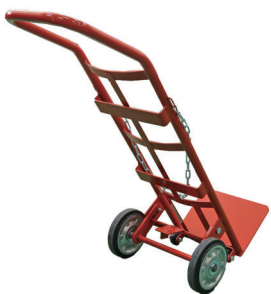
アンモニアポンベ 運搬車