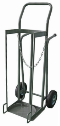
ポンベ運搬車 ノーパンクタイヤ付