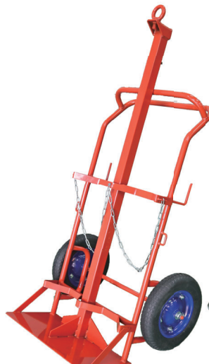
ポンベ運搬車 吊上支柱付