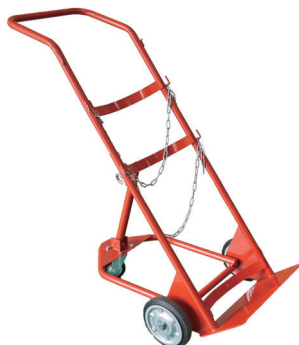
アセチレンポンベ運搬車 三輪仕様