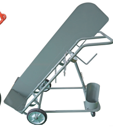
No. 47 仕切板付 消火器ボックス付