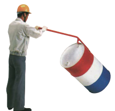
ドラム缶 起こし器