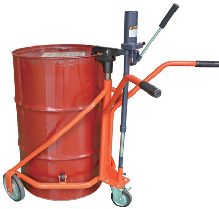
軽便ドラムカー プレス車輪付 300kg