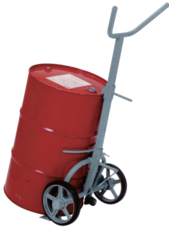
No.59-300B ドラム缶用運搬車