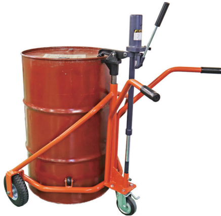
軽便ドラムカー ノーパンククッション缶付 300kg