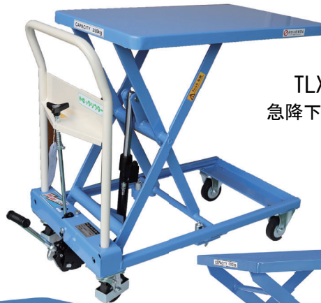
TLX-H250-85 急降下防止バルブ付