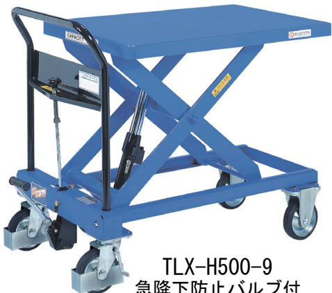
TLX-H500-9 急降下防止バルブ付