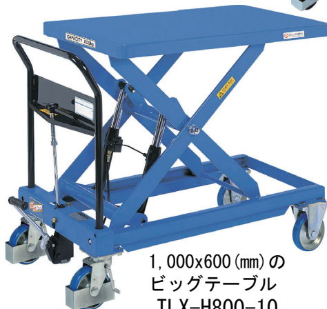
1,000x600 (mm) の ビッグテーブル TLX-H800-10 急降下防止バルブ付