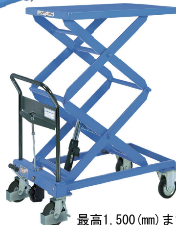
最高1,500 (mm) まで 高揚程実現 TLX-WH300-15 急降下防止バルブ付