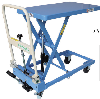
TLX-H150-73 ハンドル折り畳み式