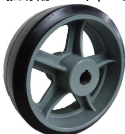
HA300x100 30φH7 キー8x3.3