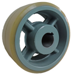
UHA200x90 40φH7 キー 12x3.3