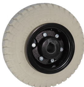
ALA3.50-5 25φH7 キー 8x3.3 ホワイトタイヤ仕様