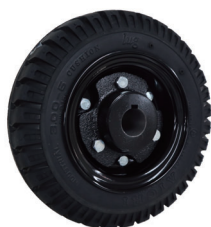
UCA3.00-5 25φH7 キー 8x3.3