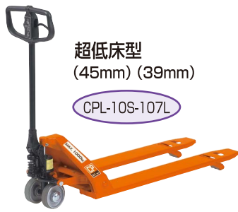
超低床型 (45mm) (39mm)