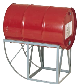
No.591 ドラムホルゾナー