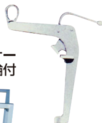
No.58 ドラムグリッパー