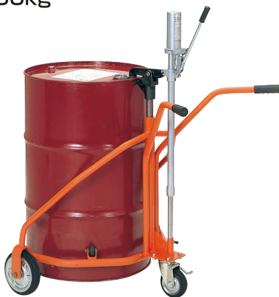
No.60-300 軽便ドラムカー プレス車輪付 300kg