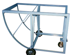
No.591-C ホルゾナー 車輪付