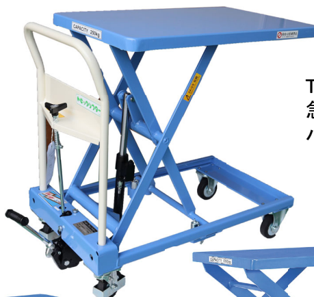
TLX-H250-85 急降下防止バルブ付