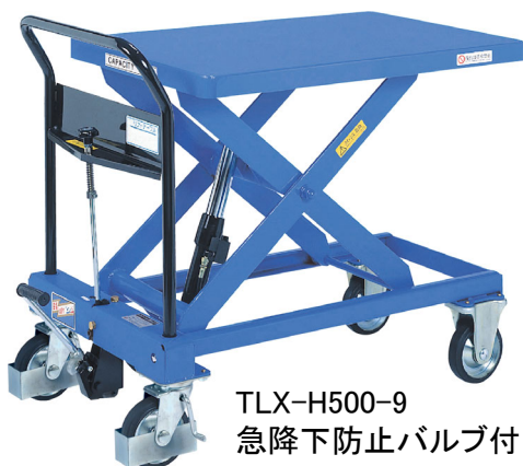
TLX-H500-9 急降下防止バルブ付