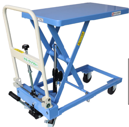
TLX-H150-73 ハンドル折り畳み式