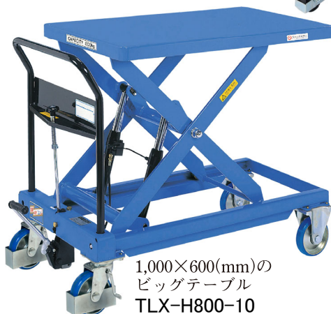
1,000×600(mm)の ビッグテーブル TLX-H800-10 急降下防止バルブ付